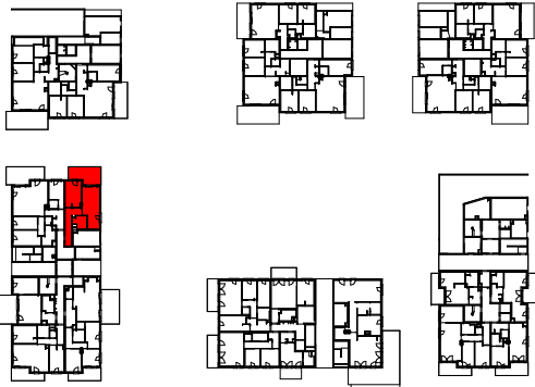
Plan de localisation