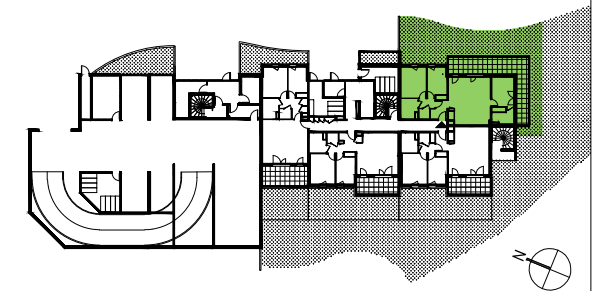
PLAN DE PRECOMMERCIALISATION