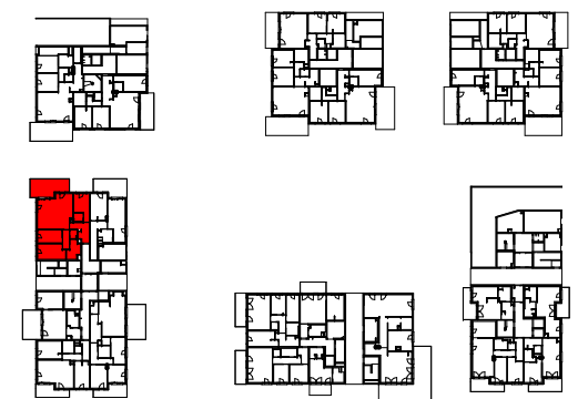
Plan de localisation