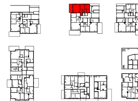
Plan de localisation