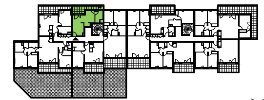
PLAN DE PRECOMMERCIALISATION