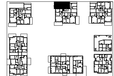
Plan de localisation