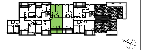
PLAN DE PRECOMMERCIALISATION