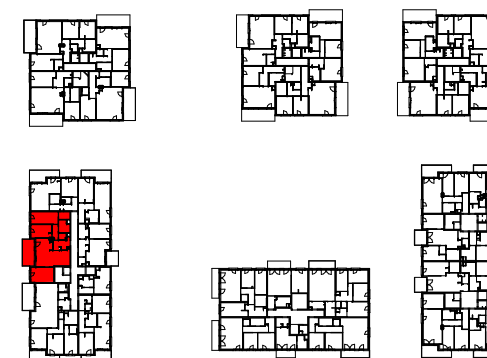
Plan de localisation